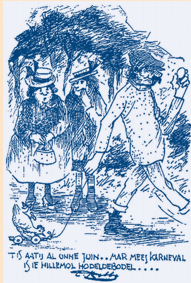
Cees Robben – Prent van de week; in: Nieuwsblad van het Zuiden, 14 januari 1977

En ook Diest blijkt Tielebuis niet te zijn vergeten. Nog steeds is er daar een carnavalsgilde dat zijn naam draagt, met een eigen website. Het verhaal van Tielebuis is inderdaad absurd maar niet zonder moraal. Tielebuis verneemt van zijn vader dat hij 'een jaar te vroeg geboren' is, dus buiten de echt. Daarom eist Tielebuis, "met Luttel verstants" en "geheel pepel sodt", dat hij opnieuw 'gedragen' zal worden en ter wereld komen. Dat lukt met behulp van twee dames, en dankzij een "oude baghijne" uit het klooster waar ze hem in een zak te vondeling leggen, komt hij ook nog eens in het bezit van een flinke som geld. De moraal wordt door Tielebuis zelf uitgesproken: "Gelt en goet wordt ongelijk gecregen.. In swerrelts pleijn ..." 'Zo gek als Tielebuis' is een van de weinige vergelijkingen waarin een historische literaire figuur de 'naamgever' is. Dat is ook het geval in een ander in Brabant wijdverbreid gezegde, al zullen we daarin niet zo makkelijk een eigenaam meer herkennen: 'zo gek als een juin'. Als regionaal gezegde is deze uitdrukking voor het eerst opgetekend door Brabantius (schuilnaam van Hendrikus van den Brand) in 1882. In zijn Woordenlijst der Noord-Brabantsche Volkstaal nam hij bij het trefwoord 'juin' op: "...algemeen is de uitdrukking: zôd gek as ëne juin." Maar hij moest toegeven: "Wat gek daarin steekt, weet ik niet." 9