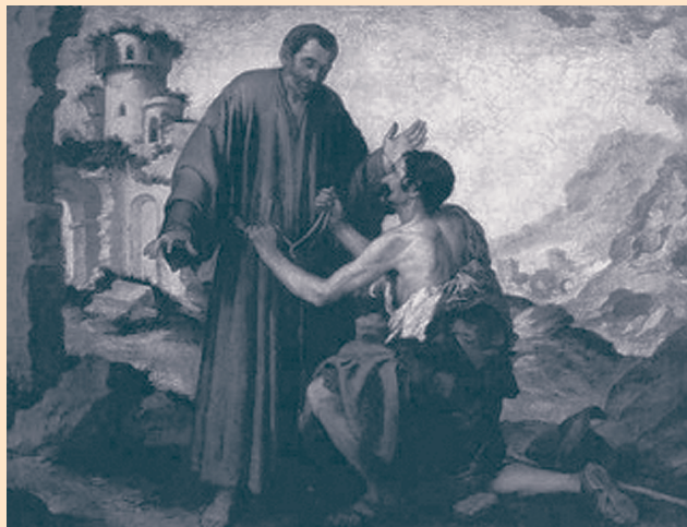
Murillo – Broeder Juniperus en de bedelaar; 17 de eeuw